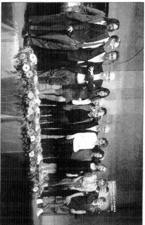
Calorosi applausi Una foto di gruppo al termine della XXVIII edizione del Festival delle Cerase

► MONTEROTONDO Chiusura in "bellezza" del XXVIII Festival delle Cerase: sciolto quest'anno per la prima volta a Monterotondo che, considerato il successo ottenuto, si propone come "città ideale" per ospitarlo anche per le prossime edizioni. Paolo Sorrentino ha conquistato la ciliegia d'oro, il premio più prestigioso della manifestazione dedicata al cinema italiano, con "La Grande Bellezza", pellicola di stampo felliniano sulla città eterna. Il pubblico di Monterotondo, accolto numerosissimo nel cortile di Palazzo Orsini, ha tributato una calorosa accoglienza al regista napoletano che ha ricevuto con grande soddisfazione il primo premio per il suo ultimo, molto discusso, film: "Sono molto felice", ha detto Sorrentino - che si torna a parlare di cinema. Il film ha una dimensione sentimentale, non